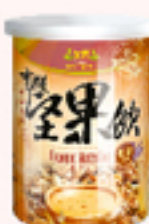
有機燕麥堅果飲 (含糖)