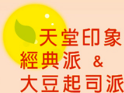
天堂印象 經典派 & 大豆起司派 Heaven's Silhouette - Classical Pie & Soy Cheese Pie