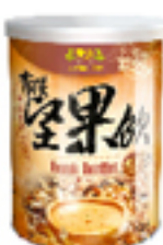
有機燕麥堅果飲 (無糖)