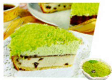
薄荷巧克力經典派