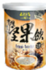
有機芝麻堅果飲 (無糖)