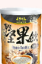
有機芝麻堅果飲 (含糖)