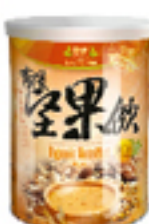
有機黃豆堅果飲 (含糖)