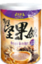
有機黑米堅果飲 (含糖)