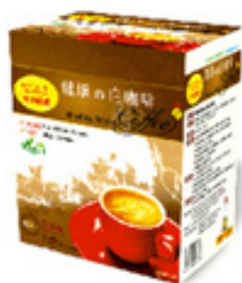
健康の白咖啡(2 in 1)