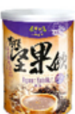
有機黑米堅果飲 (無糖)