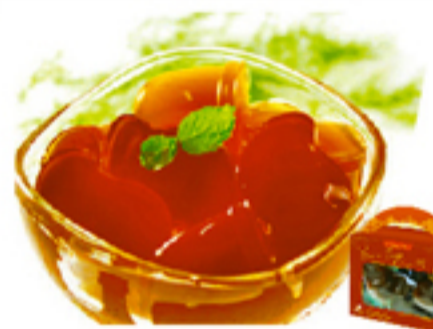
黑糖蜜苺蒟蒻果凍