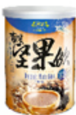
有機黑豆堅果飲 (無糖)