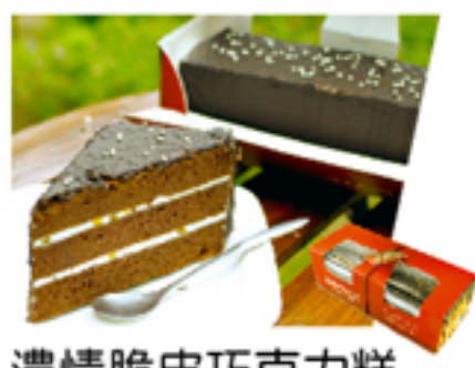
濃情脆皮巧克力糕