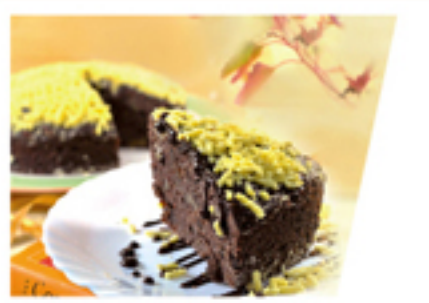
巧克力布朗尼素糕