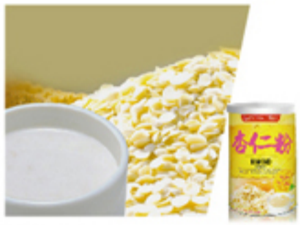
杏仁粉 (無添加杏仁香精)