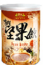
有機什穀堅果飲 (無糖)