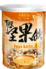
有機黃豆堅果飲 (無糖)