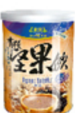
有機黑豆堅果飲 (含糖)