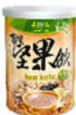
有機五穀堅果飲 (含糖)